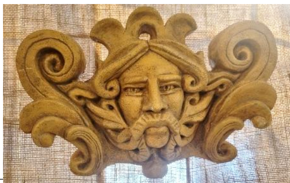
Mascaron « le Fleuve » en gypse patiné. Une symbolique du fleuve Garonne ou Gironde

La grande surprise a été la participation très nombreuse. Les danseurs souriants venaient de Paillet (pour