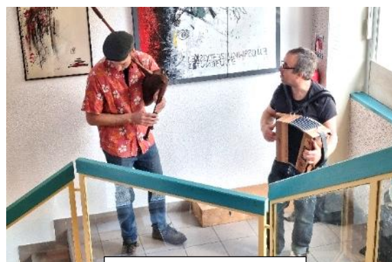
Groupe Solune Duo

quelques-uns) mais, surtout, ils étaient des habitués de ces bals et certains venaient de loin pour danser à Paillet.